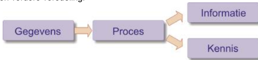
Figuur 1. Van gegevens naar informatie en kennis

Dit gegevensproces is analoog aan het fabricageproces, waarin grondstoffen getransformeerd worden tot producten. Deze producten kunnen echter halffabrikaten zijn, die dan weer de grondstof vormen voor een verdere veredeling.