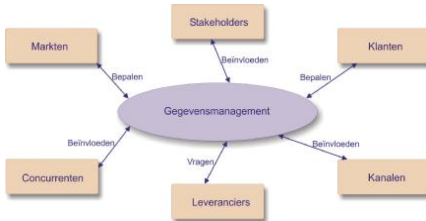
Figuur 4. Centrale positie gegevensmanagement

Deze principes zijn in lijn met de trends die in hoofdstuk 2 van deze publicatie zijn genoemd.